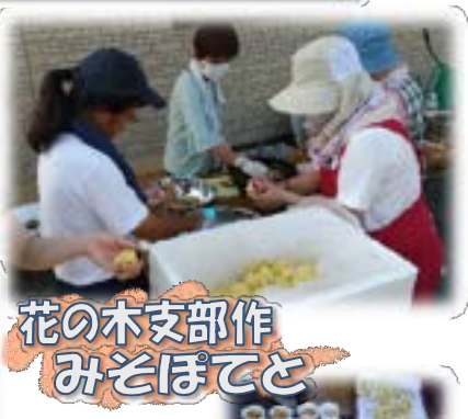
花の木支部作 みそぼてと