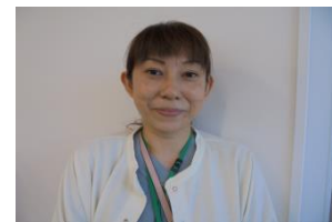
近藤 有希 小多機うきしろから 包括ほんまるへ